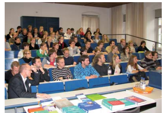
Die Ulmer Medizinstudenten haben den Weissenauer Studentenunterricht erneut als ihre beste klinische Lehrveranstaltung bewertet.

dentlich erfreulich“, zumal das ZfP Südwürttemberg „mit einer Vielzahl an fast ausnahmslos hervorragenden Lehrveranstaltungen“ verglichen wird. Steinert weiß: „Die Anstrengungen diesbezüglich sind inzwischen allgemein groß.“