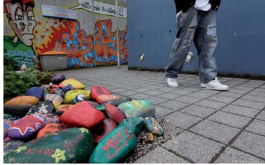
Die Behandlungsstation für Jugendliche mit Drogenproblemen wird erweitert und bekommt eine eigene Einheit für sehr junge Suchtpatienten.