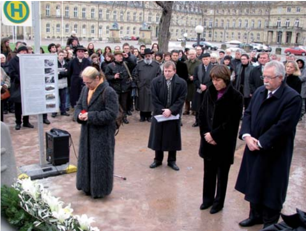
Derzeit steht ein Teil des Mahnmals auf dem Stuttgarter Schloßplatz.