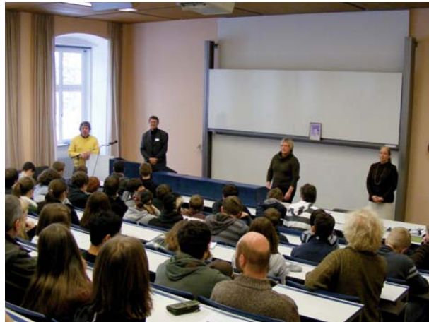
Jährlich kommen 180 Schüler nach Weissenau zu Informationsveranstaltungen über die „Euthanasie-Aktion“.

den ZfP-Mitarbeitern die ethischen Herausforderungen ihrer heutigen Arbeit bewusster.