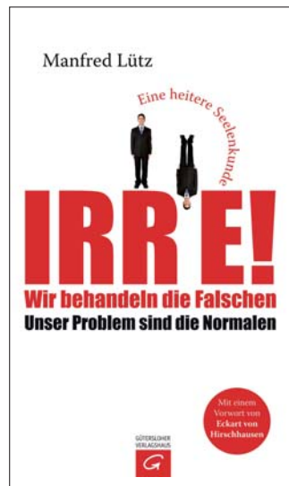
Das Buch „Irre! Wir behandeln die Falschen. Unser Problem sind die Normalen. Eine heitere Seelenkunde.“ von Manfred Lütz ist 2009 im Gütersloher Verlagshaus erschienen. Es hat 208 Seiten und kostet 17,95 Euro. ISBN: 978-3-579-06879-4

Kriegshetzer, Terroristen, Mörder, Wirtschaftskriminelle - sie alle werden als „normal“ und nicht psychisch krank angesehen! Der Psychiater und Kabarettist Manfred Lütz nimmt dazu in seinem Buch Stellung. Er meint: Wir behandeln die Falschen - unser Problem sind die Normalen! Lütz argumentiert, dass Hitler beispielsweise zu den „Normalen“ gezählt werden müsse, denn würde er als „krank“ eingestuft werden, so wäre er möglicherweise schuldunfähig gewesen, was auch wiederum paradox ist! Solche Beispiele sind die Stütze der Lützschen These. Demgegenüber beschreibt er, wie bunt, außergewöhnlich und extraordinär psychisch Kranke sind und was „Normale“ von Demenz- und Suchtkranken lernen können. „Normalos“ schneiden in seinem Buch eher schlecht ab, wobei er glaubt, noch nie einem begegnet zu sein. Als „normal“ bezeichnet er nur manche vorübergehende Verhaltensweisen.