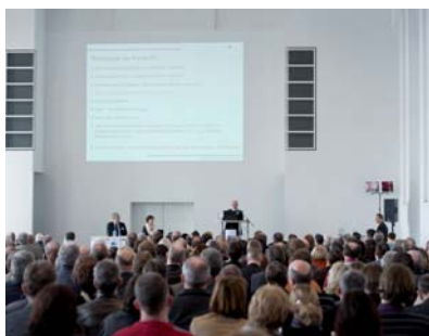
400 Mitarbeiter des Gesundheitswesens trafen sich zur Tagung im Berliner Rathaus Schöneberg

Eine Tagung zum Thema „Psychiatrische Versorgung und neues Entgeltsystem: Interessen - Erfahrungen - Perspektiven“ hat das ZfP Südwürttemberg im Februar im Berliner Rathaus Schöneberg mit veranstaltet. Bei der Fachtagung wurden nicht nur ökonomische und finanzrechtliche Aspekte diskutiert, sondern auch, wie sich die Neuerung auf den Ausbau moderner Versorgungsformen, das Personalmanagement oder neue psychiatrische Behandlungsstrategien auswirkt. 400 Teilnehmer nutzen die Gelegenheit, sich intensiv mit der Entwicklung klinischer Angebote in den Bereichen Psychiatrie, Psychotherapie und Psychosomatik und der Vernetzung mit dem gemeindepsychiatrischen Hilfesystem zu befassen. Als Experten von Seiten des ZfP