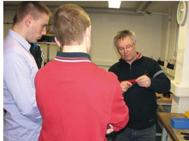
Die Polizeischüler erfuhren, dass Arbeit in der Werkstatt als Therapiemaßnahme zu verstehen ist.

In den Gesprächsrunden mit den Patienten versuchten vor allem die Schüler, möglichst viel für ihren späteren Beruf zu lernen. Sie fragten die Patienten, wie sich Krisen äußern, welche Störungen dahinterstecken, nach ihrer vermuteten Außenwirkung sowie nach Erfahrungen mit der Polizei. Die Polizeischüler zeigten sich überrascht, wie offen die Patienten über ihre Vergangenheit sowie über ihren