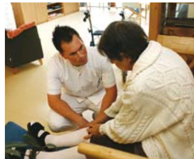
Derzeit arbeiten in den Heimen und Kliniken des ZfP Südwürttemberg rund 1500 Pflegekräfte.

Ab 1. Juli wird für die 800 000 Pflegekräfte in Deutschland ein Mindestlohn festgesetzt. Die Pflegekommission fordert für den Westen einen Stundensatz von mindestens 7,50 Euro. Nur so könne die Qualität in der Pflege weiterhin gewährleistet werden. Im ZfP Südwürttemberg investiert man schon lange in qualifizierte und motivierte Fachkräfte.