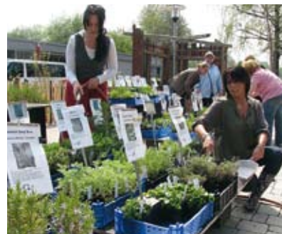
Der Frühlingsmarkt ums Weissenauer Lädle dauert noch bis Ende Mai. Verkaufszeiten sind montags bis freitags von 10 bis 18 Uhr und samstags von 10 bis 14 Uhr.

Zum dritten Mal veranstaltet die Weissenauer Gärtnerei des ZfP Südwürttemberg rund ums Weissenauer Lädle ihren Frühlingsmarkt. Mehr als 40 Beschäftigte der Weissenauer Werkstätten haben rund 10 000 Setzlinge gehegt und gepflegt. In den Gewächshäusern beim ZfP werden mehr als 400 Pflanzenarten gezogen. Das Sortiment reicht von Kräutern über Gewürze, Stauden und Blumen. Im Gewächshauszelt neben dem Lädle sowie im eingezäunten Bereich zwischen Lädle und Bistro werden die Pflänzchen und größeren Pflanzen feilgeboten. Wer möchte, kann seine Balkonkästen bepflanzen lassen. Nebenbei wird im Bistro gebacken und gekocht, so dass sich die Besucher bei einem kleinen Imbiss stärken können.